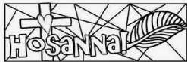
un signet à colorier